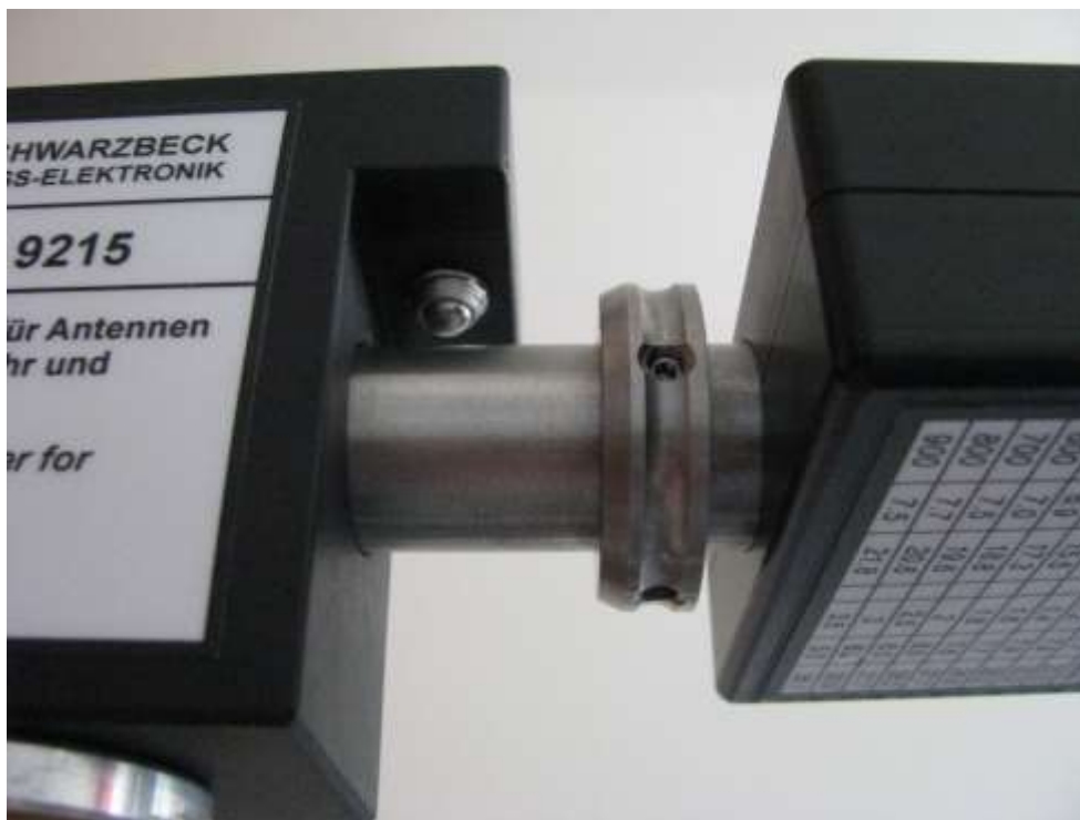
Fig. 2: Detail RA 9215 und Rastring Detail RA 9215 and indexing ring

Dimensions without lever For tube diameter: For diameter of the indexing ring: Weight: Threads on bottom: