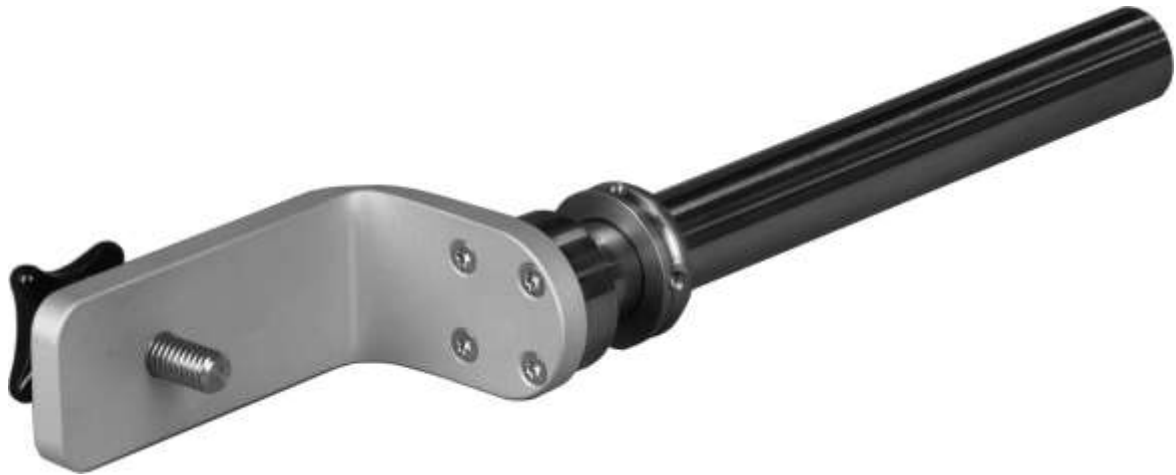
Fig. 4: AA 9213

Rastadapter RA 9215 für rastenden Wechsel der Polarisierung Indexing adapter RA 9215 for fast & precise polarisation change